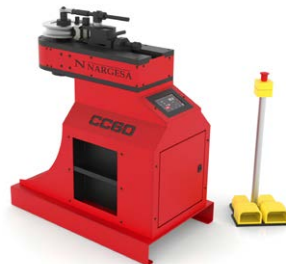
CINTREUSE À TUBES SANS SOURIS