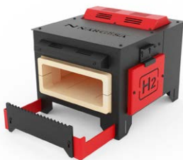
FOURS DE FORGE