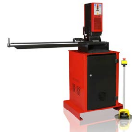
PRESSES DE SERRURES