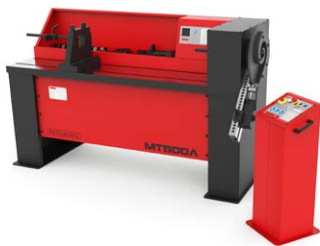
CINTREUSES À VOLUTES