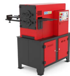
MACHINES À FORGER À CHAUD