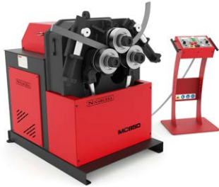
CINTREUSES À GALETS