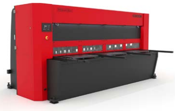
CISAILLES GUILLOTINES HYDRAULIQUES