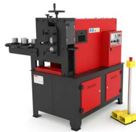
MACHINES À GAUFREUR À FROID