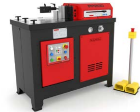
PRESSES PLIEUSES HORIZONTALES