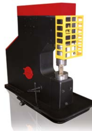
MARTEAUX PILON POUR LA FORGE