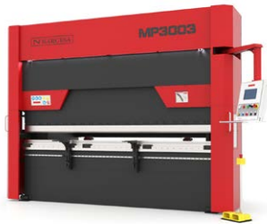
PRESSES PLIEUSES HYDRAULIQUES